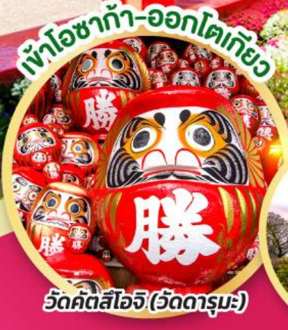
เข้าโอซาก้า-ออกโตเกียว