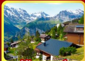
หมู่บ้านเมอร์สเรน