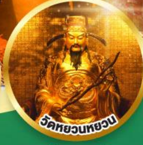
วัดหยวนหยวน ขอพรเรื่องสุขภาพ, โชคลาภ ความเจริญก้าวหน้า

เมนูพิเศษ! ต้มช้ำฮ่องกง, บุฟเฟต์ชาบูสไตล์ฮ่องกง, ห่านย่าง