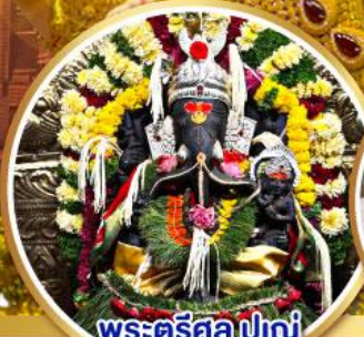
พระศรีศูล ปูเน่ (Trishul Pune)