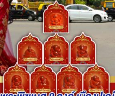
พระพิฆเนศ 8 องค์ เมืองปูเน่