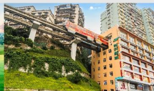
รถไฟฟ้าทะลุถ้ำ