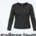
สวมฮีทเทค (Heattech) แบบหนาพิเศษด้านใน