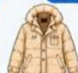
เสื้อโค้ทกันหนาว ตัวหนา