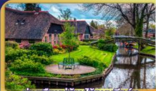
ล่องเรือหมู่บ้านไรต์นันทูร์น