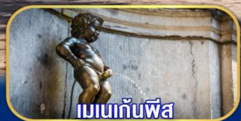
เมเนกันพีส์