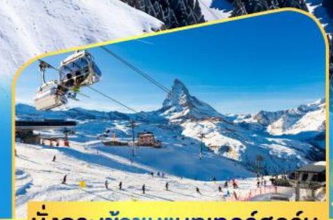
นั่งกระเช้าชมแมทเทอร์ฮอร์น