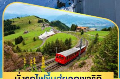
นั่งรถไฟขึ้นสู่ยอดเขาโรติก