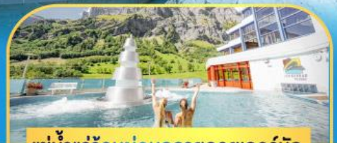
แช่น้ำแร่ร้อนผ่อนคลายลวยคอร์บิค