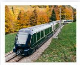
รถไฟโกลเด้นพาส