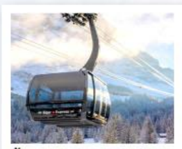
ขึ้นกระเช้ายอดเขาจุงเฟรา