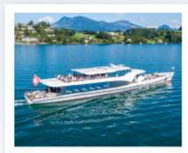
ล่องเรือทะเลสาบลูซีร์น