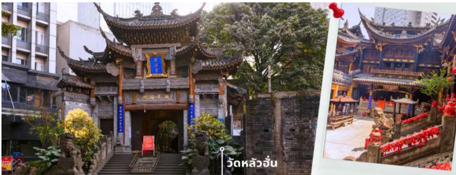
วัดหลัวฮั่น

นำท่านเดินทางสู่ วัดหลัวฮั่น (Luohan Temple) วัดสำนักงานใหญ่พุทธสมาคมแห่งนครฉงชิ่ง เป็นวัดเก่าแก่ที่สุดในฉงชิ่ง (Chongqing) ซึ่งสร้างขึ้นเมื่อ 1,000 ปีก่อน มีประวัติความเป็นมายาวนานเป็นจุดหมายทางศาสนาและเป็นศูนย์กลางของชาวพุทธในภูมิภาคการท่องเที่ยวที่สำคัญของภูมิภาค และเป็นแหล่งเรียนรู้ที่สำคัญของศิลปวัฒนธรรมจีน วัดนี้ประดิษฐานพระอรหันต์ถึง 500 องค์ แต่ละองค์มีลักษณะ ท่าทาง และสีหน้าแตกต่างกัน มีสถาปัตยกรรมแบบจีนโบราณที่สวยงามและละเอียดอ่อน พระอรหันต์ 500 องค์ แกะสลักด้วยหินและไม้ สะท้อนถึงความเชื่อในพุทธศาสนาและมีมือศิลปะจีน