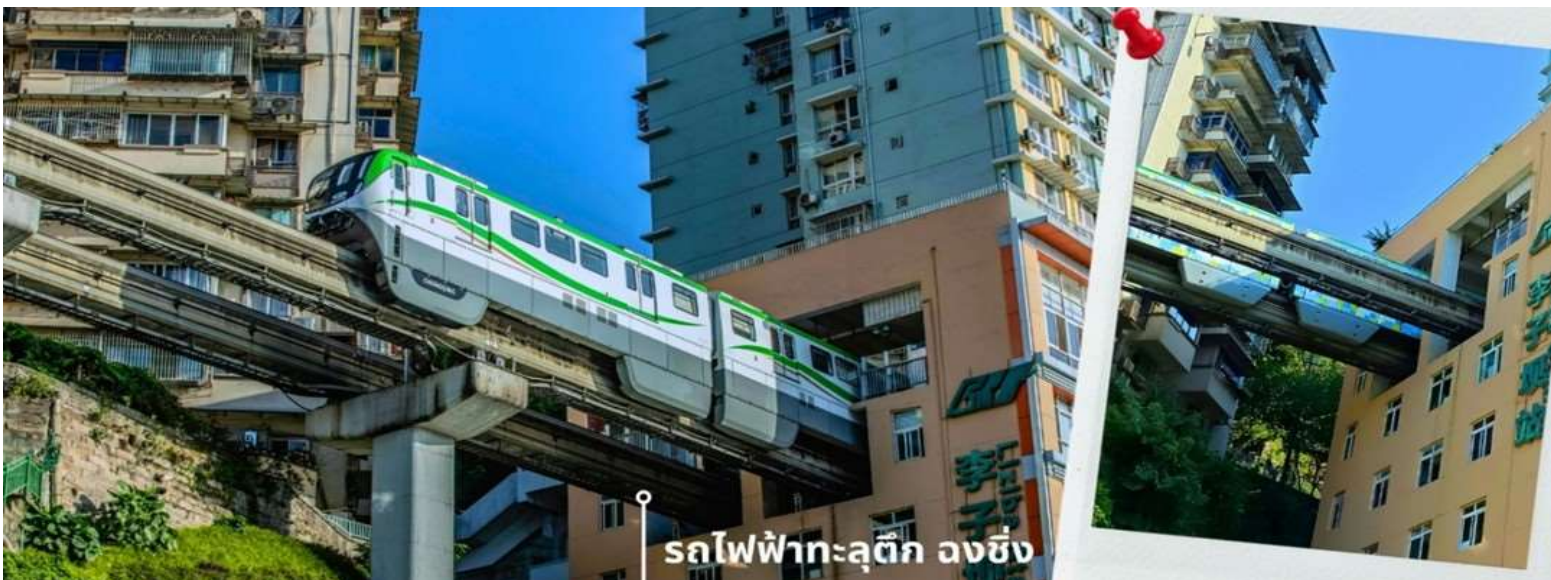
รถไฟฟ้าทะลุตึก ฉงชิ่ง

จากนั้นนำท่านนั่งรถไฟฟ้าทะลุตึก หรือ สถานี Liziba เป็นสถานีรถไฟฟ้าแบบขานชาลา สิ่งที่ทำให้สถานี Liziba มีชื่อเสียงไปทั่วโลกคือ “เส้นทางรถไฟที่วิ่งทะลุผ่านอาคารสูง 19 ชั้น” โดยมีระบบลดเสียงและแรงสั่นสะเทือน ทำให้ผู้ที่อาศัยอยู่ในตึกไม่ได้รับผลกระทบจากเสียงดังมาก กลายเป็นภาพอันน่าตื่นตาตื่นใจของผู้ที่มาเยือนทั้งนักท่องเที่ยวที่เดินทางมาเป็นครั้งแรก ผู้โดยสารบนขบวนรถไฟและผู้เข้าชมจากจุดชมวิวก็ต่างตื่นเต้นไปตามๆกันกับการที่ได้เห็นรถไฟวิ่งทะลุตึกนี้ สถานี Liziba ได้รับการยกย่องให้เป็น 1 ในสถานที่สำคัญที่สะท้อนความเติบโตของจีนตลอด 70 ปี ซึ่งไม่ได้เกิดขึ้นโดยบังเอิญ รถไฟฟ้าทะลุตึกนี้คือตัวอย่างของความอัจฉริยะในการออกแบบการคมนาคมในเมืองภูเขาแห่งนี้ให้ท่านได้สัมผัสประสบการณ์กับการขึ้นนั่งบนรถไฟเพื่อผ่านทะลุตึกและเก็บภาพบรรยากาศ