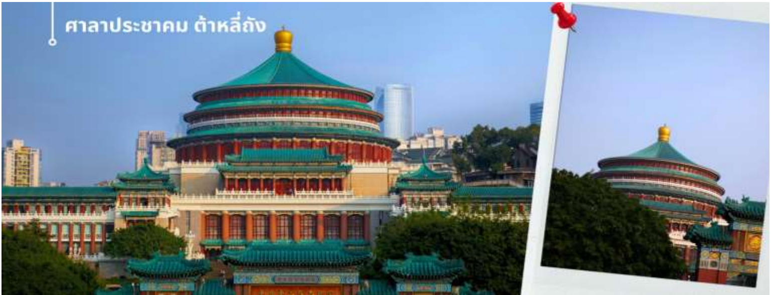
ศาลาประชาชน ท่าหลี้ถิง

นำท่านเดินทางสู่ ศาลาประชาชน (ด้านนอก) เป็นสถานที่หนึ่งในสัญลักษณ์ของเมืองฉงชิ่ง ด้วยสีส้มและรูปแบบการจัดวางอย่างโดดเด่นและลงตัว มีการผสมผสานของศิลปะในยุคราชวงศ์หมิงและราชวงศ์ชิงเข้าไว้ด้วยกัน ด้านหน้าจะเป็นลานกว้างในตอนเย็นและตอนกลางคืนจะมีผู้คนจำนวนมากเข้ามารวมตัวกันทำกิจกรรม ไม่ว่าจะเป็นการเต้นแอโรบิก เดินเล่น ปิกนิก เดินชมแสงไฟยามค่ำคืน จัดนิทรรศการต่างๆ