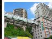
รถไฟหอคูตึก

ภูเขาถวงอู่ชาน (รวมกระเช้า) • อุทยานหมีซานซาน หินแกะสลักหนานคาน • ชมรถไฟหอคูตึก หงหยาดัง • ถนนคนเดินเจี๋ยฟางเป่ย์