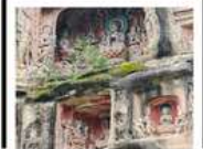
หินแกะสลักหนานคาน