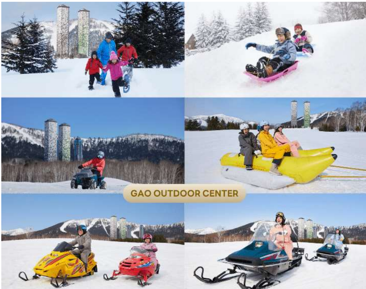
GAO OUTDOOR CENTER

นำท่านสู่ โฮชิโนะริรีสอร์ทโทมามุ (Hoshino Resort Tomamu) ให้ท่านได้สนุกสนานไปกับกิจกรรมทางทิมะ ณ GAO OUTDOOR CENTER กิจกรรมที่มีบริการอยู่ไม่ว่าจะเป็น Snow Raft เรือยางขนาดใหญ่ที่สามารถนั่งเป็นกลุ่ม หรือเดี่ยว ไหลลงจากเนินตามเนินเขาที่กำหนด และยังมี Banana Boat ซึ่งลากด้วยสโนว์โมบิลไปตามทางซิกแซกสันเนินสร้างความสนุกสนานตื่นเต้นได้มากเลยทีเดียว และ Sled สำหรับพาหนะส่วนตัวที่ไหลลงจากเนินสูง ตื่นเต้นเร้าใจไปกับการขี่ SNOW MOBILE เรียกได้ว่าคนจะเป็นมือใหม่หรือโปรก็ต้องสนุกไปกับการเล่นสกีของที่นี่แน่นอน (ราคาทัวร์ไม่รวมค่าเช่าชุดกันหนาว และอุปกรณ์การเล่น)