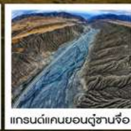
แกรนด์แคนยอนดูซานเจี๋ย