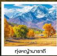
ทุ่งหญ้านาราตี

ทัวร์คุณธรรม ไม่ลงร้านช้อปปิ้ง ไม่ขายออฟชั่น