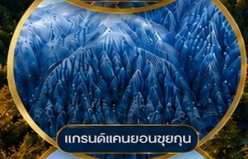
แกรนด์แคนยอนซูยกุน