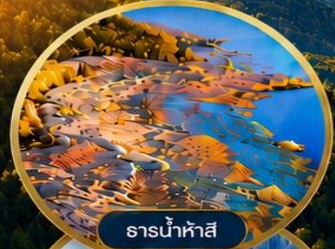
ธารน้ำห่าสี