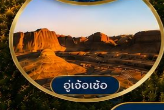
อู่เจ้อเซ่อ