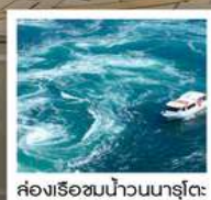
คลองเรือขม่นาวนาสุโตะ

วัดบึงไธสง / ตลาดกั้งงะ / โมจิโกะหวาน (จุดชมวิว) / สะพานคนโตเคียว เกาะมิยาจิม่า ศาลเจ้าอิตสึคุชิมะ / สวนอนุสรณ์สันติภาพฮิโรชิมา โดโกะออนเซ็น / ถนนโมโมเตะซันโด คมปิระซัง / ปราสาทมัตสึยาม่า กิจกรรมทำเส้นอุด้ง / สวนริทสึริน / สถานีริมทางคุรุกุมางุระ คลองเรือขม่นาวนาสุโตะ / ซุปบึงย่านชินโซมาชิ / ตลาดปลาคุโรมางะ / ซุปบึงย่านอุเมะ