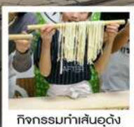
กิจกรรมทำเส้นอุด้ง