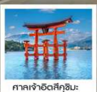
ศาลเจ้าอิตสึคุชิมะ