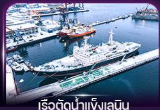
เรือตัดน้ำแข็งเลนิน