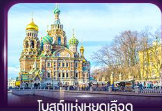
โบสถ์แห่งหยดเลือด