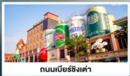
ถนนเบียร์ชิงเต่า