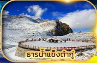
ธารน้ำแข็งต้ากู่