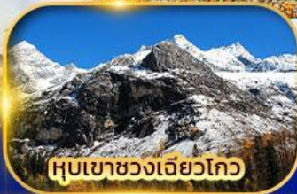
หุบเขาขวงเจียวโกว