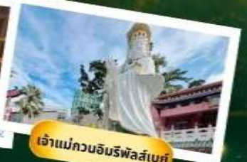
เจ้าแม่กวนอิมรพีลัสเบย์