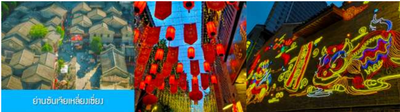
ย่านชานเจียเหลียงเซียง