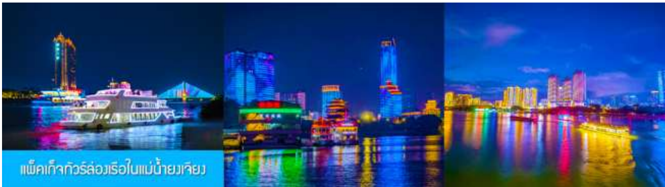
แพ็คเกจทัวร์ล่องเรือใบแม่น้ำยงเจียง

ค่ำ อิสระอาหารค่ำ เพื่อความสะดวกและคล่องตัวในการเดินช้อปปิ้ง โดยท่านสามารถลิ้มลองอาหารท้องถิ่นหลากหลายรสชาติได้ตามอัธยาศัย