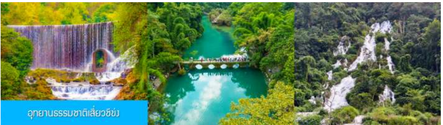
อุทยานธรรมชาติเสี่ยวชิ่ง

หลังอาหารนำท่านเที่ยวชม อุทยานธรรมชาติเสี่ยวชิ่ง 荔波小七孔景区 แหล่งท่องเที่ยวธรรมชาติระดับ 5A ที่ได้ชื่อว่าเป็น จิ่วจ้ายโกวแห่งมณฑลกุ้ยโจว โดยความสวยงามของที่นี่ไม่ได้มีน้อยหน้าไปกว่าความสวยงามของอุทยานจิ่วจ้ายโกว...ชมธารน้ำสีเขียวมรกตที่ไหลผ่านแกร่งหิน โขดหินธรรมชาติรูปล่างแปลกตา ร้อยเรียงเป็นน้ำตกน้อยใหญ่ที่เรียงรายถึง 68 ชั้น ชม สะพานเจ็ดรู 七孔桥 สะพานโบราณที่เชื่อมต่อมณฑลกุ้ยโจว และมณฑลกว๋างสีอันที่เส้นทางหลักในการลำเลียงสินค้าในยุคโบราณ และชื่อของสะพานนี้ได้กลายเป็นชื่อของอุทยานท่องเที่ยวในปัจจุบัน ชม ธารน้ำลอดช่องหิน ปรากฏการณ์ที่น้ำในลำธาร ไหลผ่านโกรกหินที่ซับซ้อน กลายเป็นภาพที่สวยงามน่าทึ่ง นอกจากธารน้ำมรกตและธารน้ำตกน้อยใหญ่ที่ไหลผ่านหุบเขาและผืนป่า ยังมีบึงน้ำน้อยใหญ่ที่สวยงามเหนือคำบรรยาย อาทิ บึงมังกรหมอบ 卧龙潭 ทะเลสาบเยียนยังหู 鸳鸯湖 ที่ต่างก็มีความโดดเด่นและงดงามไม่แพ้กัน.....(หมายเหตุ การเดินเที่ยวชมอุทยาน สามารถเข้าทางประตูทางเข้าฝั่งตะวันตก และออกประตูทางเข้าทางฝั่งตะวันออก หรือจะสลับมาเข้าทางฝั่งตะวันออกและออกทางฝั่งตะวันตก