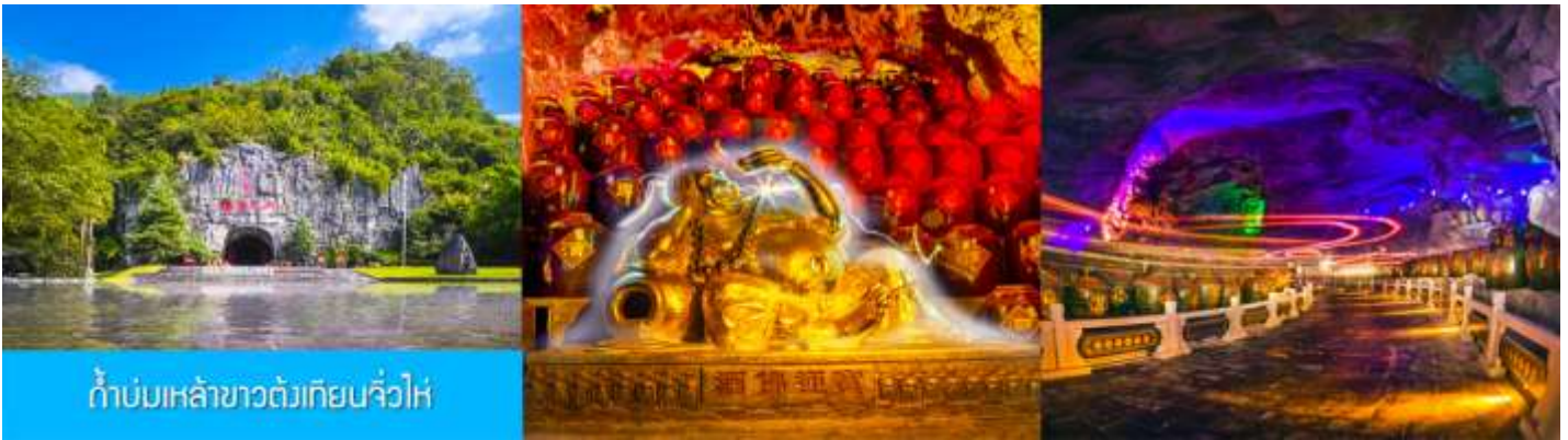
กำบ่อมเหล้าขาวตั้งเทียนจิวไห่