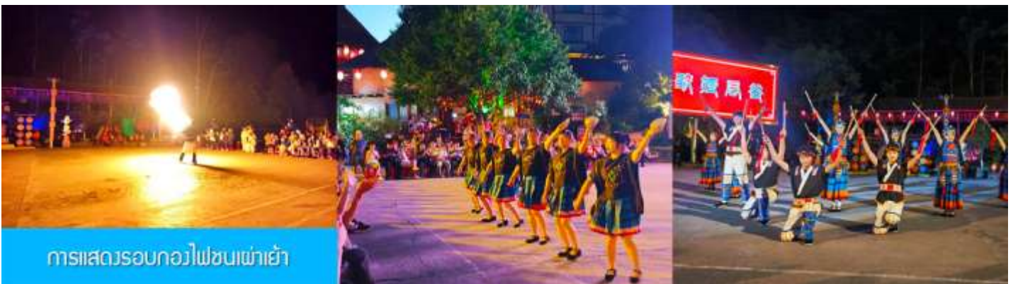
การแสดงรอบกองไฟชนเผ่าเย้า

หลังอาหารท่านสามารถชม การแสดงรอบกองไฟ 篝火表演 เป็นการแสดงพื้นเมืองของชนเผ่าเย้า (การแสดงรอบกองไฟจะงดจัดการแสดงในวันที่สภาพอากาศไม่เอื้ออำนวย) พักที่ NANDAN JINFUYAO HOTEL ระดับ 4 ดาวท้องถิ่นหรือเทียบเท่าในเมืองหนานตัน