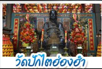
วัดบิกิตฮองฮำ