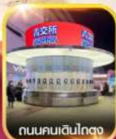
ถนนคนเดินโทง

26 - 30 กรกฎาคม 2569 28 ก.ค. - 1 ส.ค. 2569