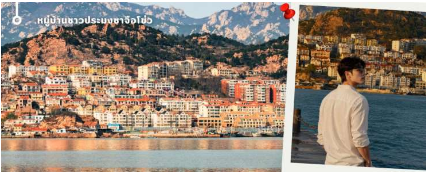
หมู่บ้านชาวประมงซาโจโซ่ว

เจียบสงบของภูเขาและทะเล พร้อมเลือกซื้ออาหารทะเลสดใหม่ และเก็บภาพความประทับใจกับหนึ่งในแลนด์มาร์กยอดนิยมของชิงเต่า