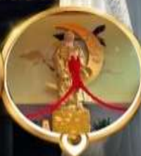
วัดหวังต้าเซียน วอพรความรัก