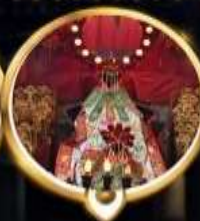
วัดเจ้าแม่กวนอิมฮ่องกง วอพรสุทภาพ