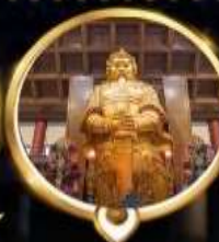
วัดแชกง วอพรโซคลาก