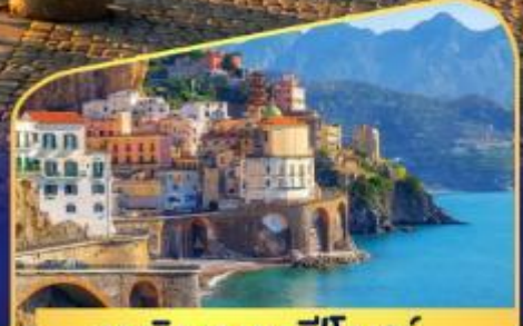
ชมวิวมอลฟีโดสก์