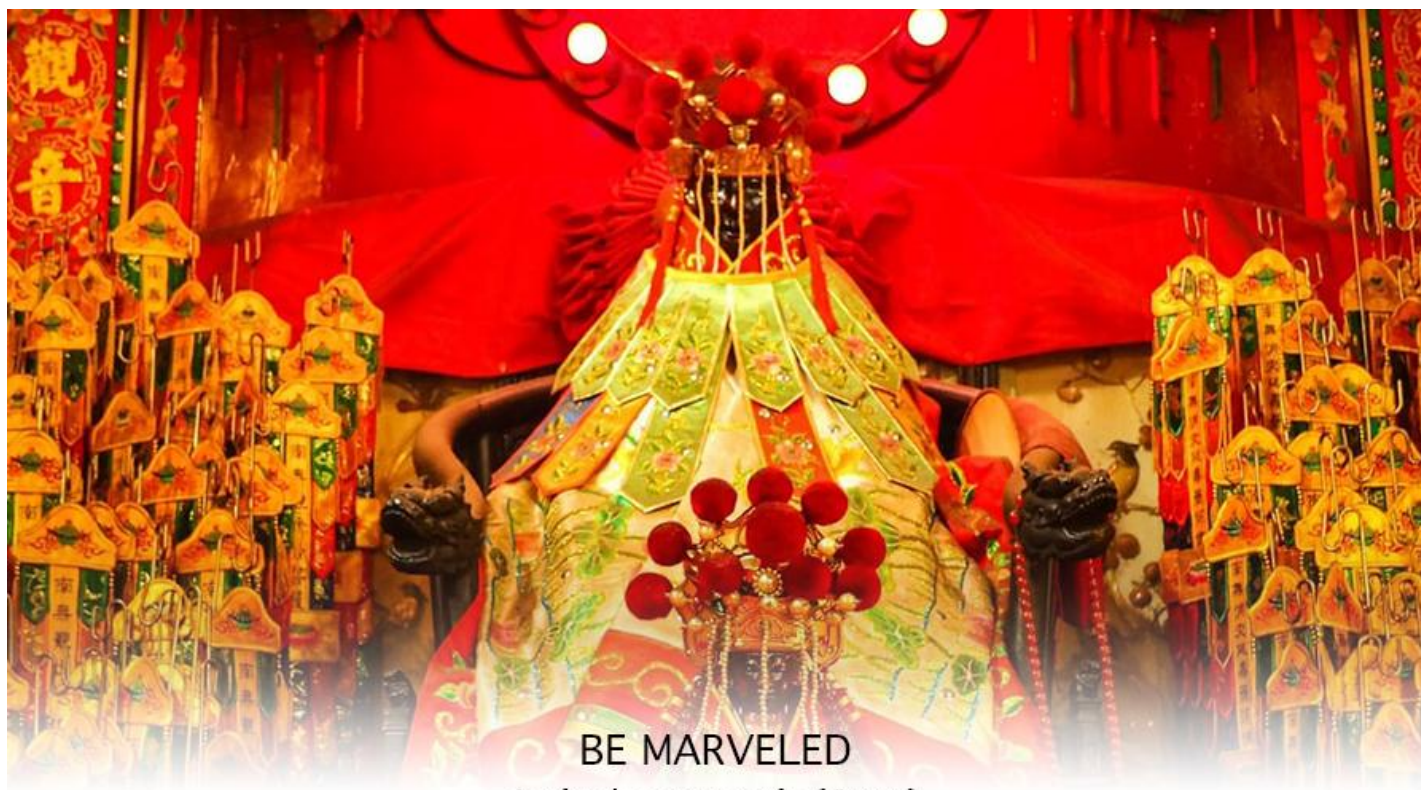
BE MARVELED วัดเจ้าแม่กวนอิมฮวงอ่า (ยิมวิน)

หรือ วันเปิดทรัพย์ เป็นความเชื่อของคนเชื้อสายจีน ทั้งฝั่งฮ่องกง และมาเก๊าถือเป็นพิธีศักดิ์สิทธิ์ในการขอพรเจ้าแม่กวนอิม เชื่อกันว่าเป็นการไหว้และการทำพิธีที่ช่วยเสริมดวงให้เงินทองไหลมาเทมา การขอยืมเงินองค์กวนอิม ที่ขึ้นชื่อเรื่องความเมตตา หรือทำการค้า เปิดธุรกิจค้าขายเจริญรุ่งเรือง