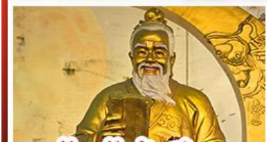
วัดเซว้งต้าเซียน

วัดเจ้าแม่กวนอิมฮ่องกง - กระเช้านองปิง พระใหญ่โป้วหลิน - เจ้าแม่กวนอิมรัฟลัสเบย์ วัดแชกงหมิว - วัดหวังต้าเซียน - วัดเจ้าแม่ทับทิม