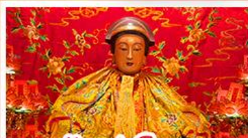
วัดเล่งจื๊อเมว