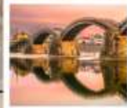
สะพานคินไตเคียว