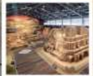
พิพิธภัณฑ์ทรายทาดะอิ