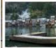
หมู่บ้านประมงฮิเมะ ฟูนายะ