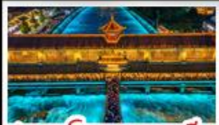
สะพานโบราณหนวยธิยว

อุทยาศำกู่ปึงชวณ - อุทยาศี่ดรุณี - หมี่แพนด้าอนเซลฟี น้ำพึนน้ำดึกSKP - อุทยาศปีเจ็งโกว - สะพานโบราณหนวยธิยว สตรึกอาร์ก Eastern Suburb Memory - เมืองโบราณลั่วใต้ เบมูพิศษ หม้อไฟหนาล่า