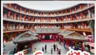
เมืองโบราณลั่วใต้