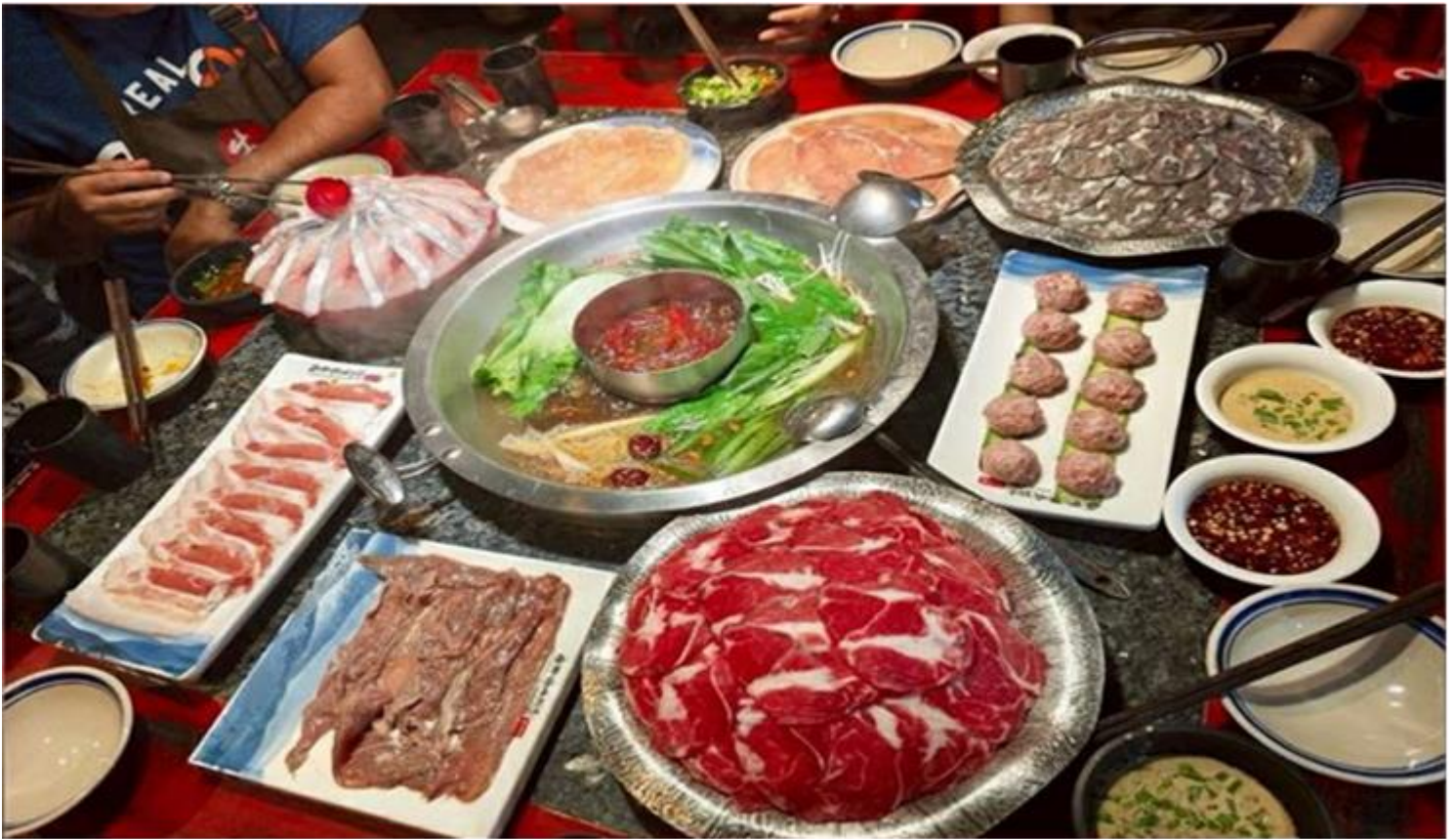
คำ รับประทานอาหารคำ ณ ภัตตาคาร (เมื่อที่ 12) *เมนูพิเศษสุกี้หม่าล่าเสฉวน

ดั้งเดิม มีทั้งแบรนด์แฟชั่นระดับโลกอย่าง Gucci, Chanel, Balenciaga รวมถึงร้านค้าไลฟ์สไตล์และแฟชั่นท้องถิ่น อาหารท้องถิ่นและคาเฟ่นานาชาติสวยๆ ที่เหมาะสำหรับการนั่งพักผ่อน