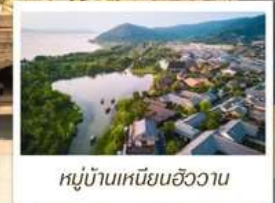
หมู่บ้านเหนียนฮิววาน