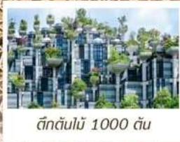
ตึกต้นไม้ 1000 ต้น