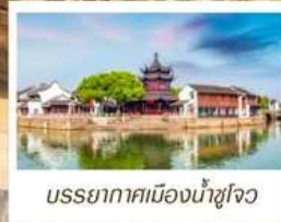
บรรยากาศเมืองน้ำซูโจว