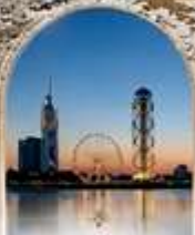
บาตูมึ BLACK SEA BOULEVARD