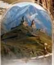
รถออฟโรด 4WD EXPERIENCE