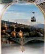
ทบิลีซี OLD TOWN