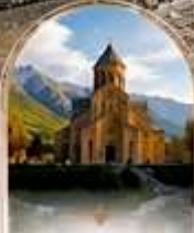
มรดกโลก UNESCO HERITAGE