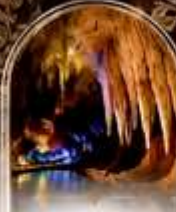
นั่งเรือชมทิวทัศน์ BOAT RIDE