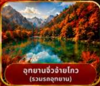
อุทยานจิวจ้ายโกว (รวมรถอุทยาน)