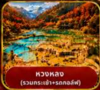
หวงหลง (รวมกระเช้า+รถกอล์ฟ)