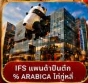
IFS แพนด้าปิ่นตึก % ARABICA ไท่กู่หลี่