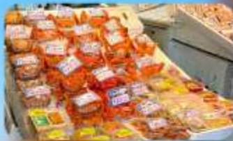
ตลาดปลาโจโก