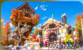
โรงงานช็อกโกแลต ชิโรอิ โคอิบิโตะ