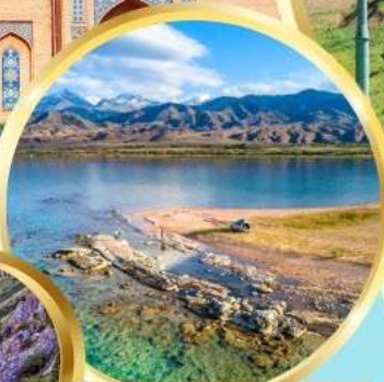
ล่องเรือทะเลสาบอิสซิค