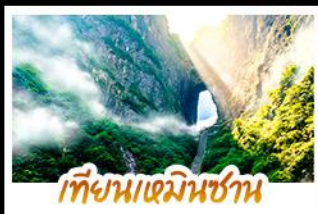
เทียนเหมินชาน

การจับตั๊กแตนเต็มอิ่มแบบไม่ลงร้าน • รวม 5 เมืองโบราณชื่อดังไว้ในทริปเดียว ขึ้นเขาอวตารด้วยลิฟท์แก้วไปหลง • นั่งกระเช้าพิชิตทำประตูสวรรค์เทียมหมื่นชา เดินท้าความเสียวบนหน้าผากระจก • ล่องเรือชมภาพเขียนแม่น้ำอูเจียง