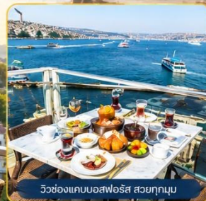
วิวช่องแคบบอสฟอรัส สวยทุกมุม