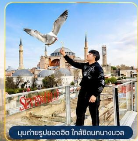
มุขถ่ายรูปรออดิต ใกล้เคียงถนนกอนสแตนติน