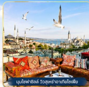
มุขโหลบฮิลล์ วิวสุเหร่าฮาเกียโซเฟีย

ช่องแคบบอสฟอรัส • สุเหร่าสีน้ำเงิน • สุเหร่าฮาเกียโซเฟีย