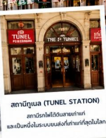
สถานีทูนเนล (TUNEL STATION) สถานีรถไฟใต้ดินสายเก่าแก่ และเป็นหนึ่งในระบบขนส่งที่เก่าแก่ที่สุดในโลก

ไอโกลด์ที่ห้ามพลาด! รถรางสีแดงสัญลักษณ์ ของย่านทักซิม