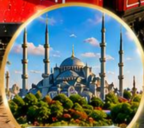
สุเหร่าสีน้ำเงิน Blue Mosque