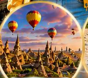
เมืองคปปาโดเกีย Cappadocia