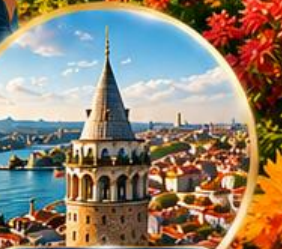
หอคอยกาลาตา Galata Tower