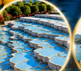
ปานุกคาล่ Pamukkale