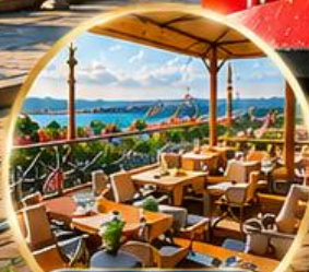
Seven Hills Cafe ชมวิว อิสตันบูล