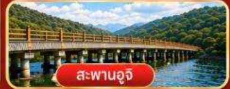
สะพานอูจิ