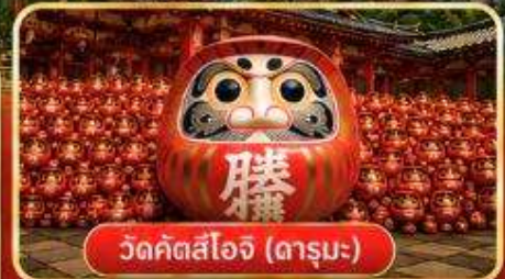
วัดคัตสึโฮจิ (ดารุมะ)