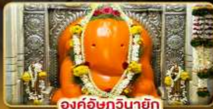
องค์อักษวินายัก