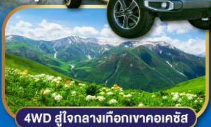
4WD สู่ใจกลางเทือกเขาคอเคซัส