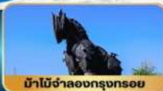
ม้าไม้จำลองกรุงทรอย