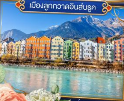
เมืองลูกกวาดอินส์บรุค