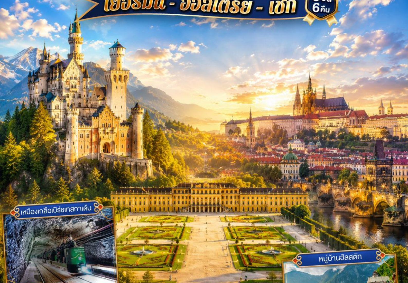
เหมืองเกลือบิรชเทสกาเดิน