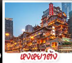
ตุงเตาตั้ง