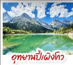
อุทยานปี่ฝิงโกว

มรดกโลกพระพุทธรูปแกะสลักหินต้าจู้ - อุทยานหลุมบ่อฟ้าสะพานสวรรค์ อุทยานเขานางฟ้า - หงหยาดัง - ดิกยูชิง ชั้น 22 - ชมรถไฟรถไฟฟ้าทะลุคิ สะพานโบราณหนานเฉียว - เมืองโบราณกวนเซี่ยน - อุทยานภูเขาสี่ตุงฉี อุทยานปี่ฝิงโกว - ถนนโบราณชอยกว้างชอยแคบ - วัดต้าอ้อ ถนนคนเดินซุนซีลู่ - หมู่เพนด้าปิ่นตักIFS - ถนนไท่กุ่หลี่