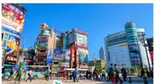
ซ้อปั้งซีเหมินติง