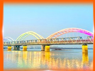
สะพานรถไฟผืนโจว