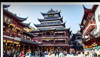
ตลาดร้อยปีเฉิงหวงเหมียว