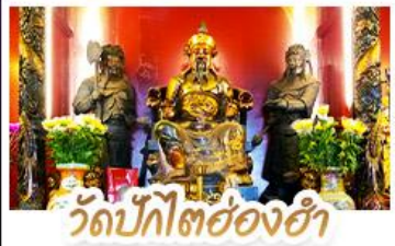
วัดปึกไค้อ่งฮ่า

นั่งกระเช้าแองปิงสักการะพระใหญ่เทียนถาน • จอพรองค์แซง โขกลาก การเงินและธุรกิจ เทพเจ้าปึกไค้อ่งฮ่า จอพรเรื่องความสำเร็จในชีวิตและการทำงาน • วัดหวังต้าเซียน สักการะสังคักสิทธี เสริมมงคลชีวิต • เจ้าแม่ทวนอิมอ่องฮ่า จอเรื่องเงิน ทรัพย์สิน และความมั่งคั่ง • อิศระท่องเที่ยว 2 วัน เสือช้อปมิตรคิสมีย์แอนด์หรือช้อปบั้งจ๊อง