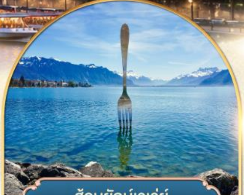
ส้อมยักเข่าเว่ย