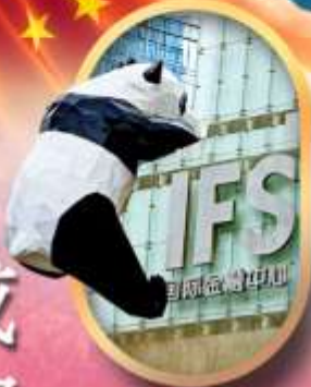
IFS หมีแพนด้าป็นดัก