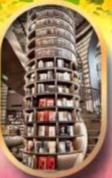
อุทยานปีติงโกว