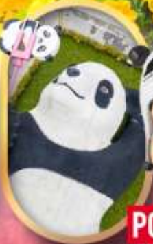
หมีแพนด้าเซลฟี