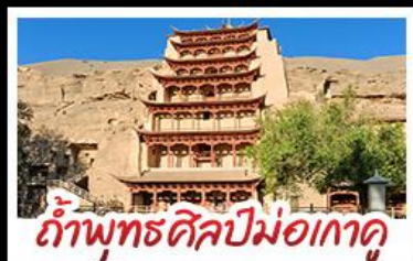
กำแพงพุทธศิลป์ม่อเกาตุ

เป็นทรายครวญ - สระน้ำวงพระจันทร์ ทะเลสาบเกลือฉางซ่า - กำพุทธรศิลป์ม่อเกาตุ หุบเขาสายรุ้งจางเย่ - ทะเลสาบซิงไห่