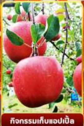
กิจกรรมเก็บแอปเปิ้ล