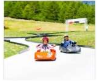
กิจกรรมขับโกคาร์ท