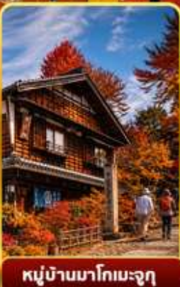
หมู่บ้านมาโกเมะจุกุ