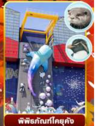
พิพิธภัณฑ์โคยูกัง

ออนเซ็น 2 คัน | นน.กระเป๋า 23 กก.X2 | 8Days 5Night