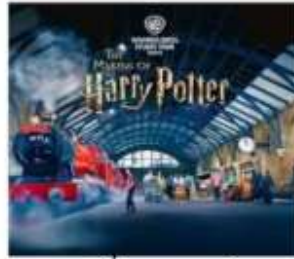
แฮร์รี่ พอตเตอร์ สตูดิโอโตเกียว