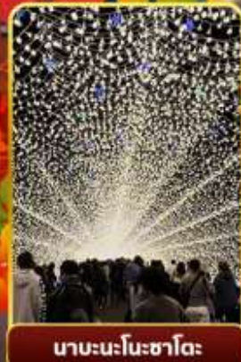
นาบะนะโนะชาโต๊ะ