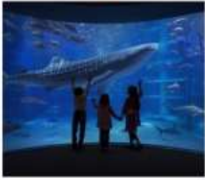
พิพิธภัณฑ์สัตว์น้ำโดยดั่ง