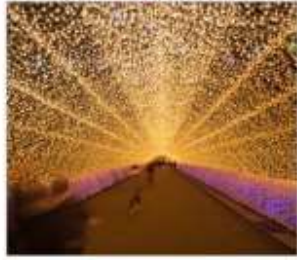
นาบนะโนะซาโตะ