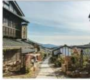
มาโกะเมะจุกุ