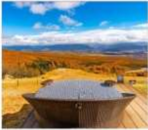
ดิโยซาโตะเทอเรส